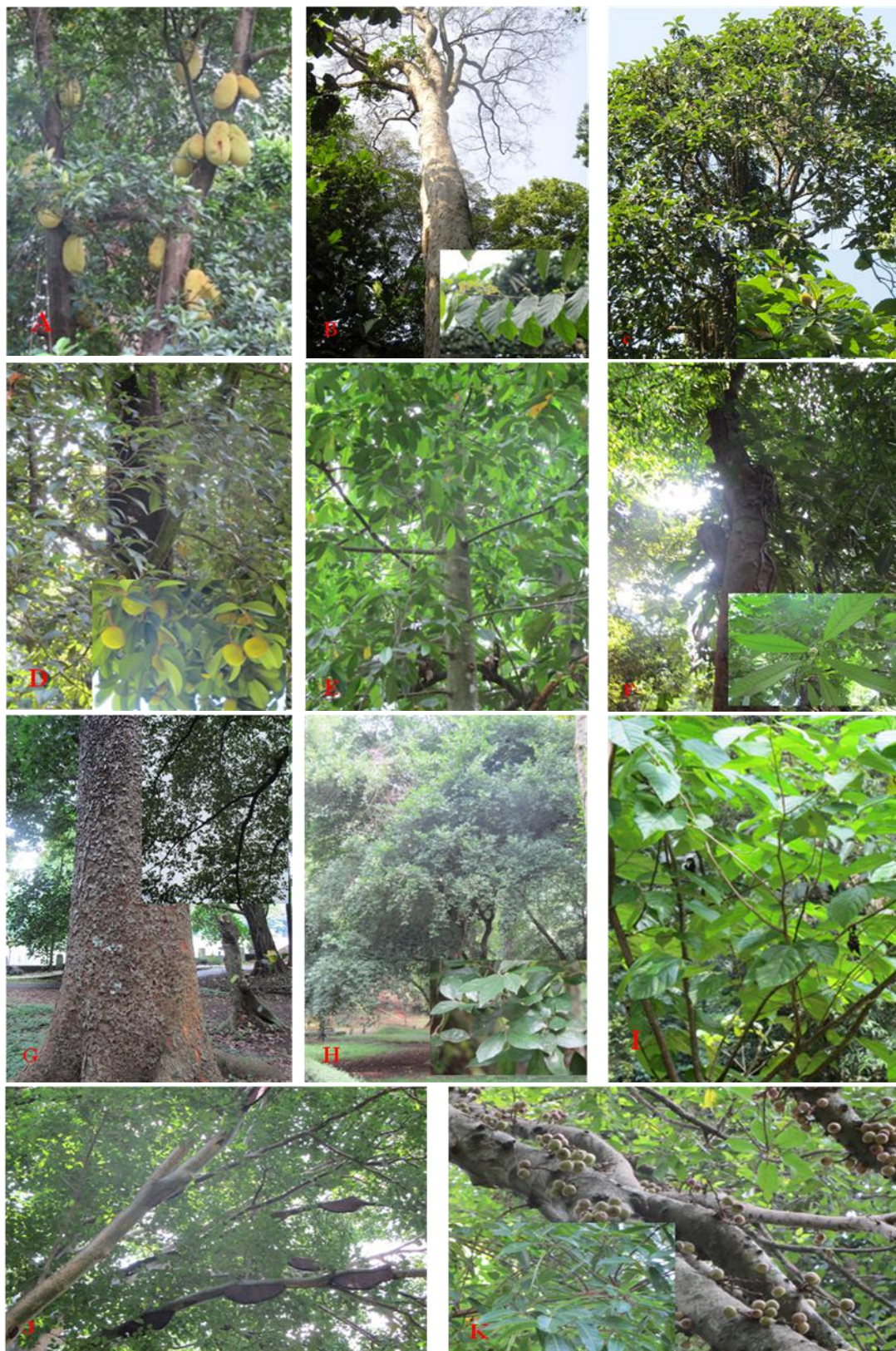
Gambar 2. Beberapa jenis Famili Moraceae pada koleksi Kebun Raya Bogor: (A) Artocarpus heterophyllus , (B) Artocarpus altissimus , (C) Artocarpus elasticus , (D) Artocarpus rigidus , (E) Antiaris toxicaria , (F) Streblus elongatus , (G) Milicia excelsa , (H) Streblus asper , (I) Morus macrourea , (J) Ficus albipila , dan (K) Ficus racemosa