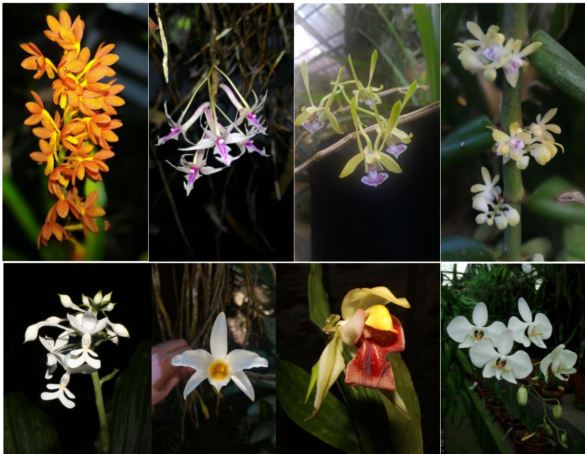
Gambar 3. Anggrek koleksi Kebun Raya Jompie, Parepare, Sulawesi Selatan yang berpotensi sebagai tanaman hias. Dari kiri ke kanan: Ascocentrum miniatum , Dendrobium rantii , Dendrobium bicaudatum , Trichoglottis lanceolaria , Calanthe triplicata , Dendrobium heterocarpum , Coelogyne celebensis , dan Phalaenopsis amabilis

dan Subedi et al. (2013) juga menginformasikan bahwa daun A. odorata digunakan untuk mengobati luka. Sementara itu, Sandrasagaran et al. (2014) melaporkan bahwa tanaman D. crumenatum (anggrek merpati) memiliki potensi sebagai antimikroba. Hal tersebut karena kandungan alkaloid dan flavonoid di dalam tanaman D. crumenatum . Hasil penelitian Sandrasagaran et al. (2014) menunjukkan bahwa ekstrak batang D. crumenatum efektif untuk menghambat pertumbuhan bakteri Staphylococcus aureus , Klebsiella pneumoniae dan Enterobacter aerogenes . Pant (2013) dalam laporannya juga mengungkapkan bahwa seluruh bagian dari tanaman anggrek Nervilia concolor digunakan untuk mengobati infeksi saluran kemih, asma, mual, diare, dan ketidakstabilan mental. Subedi et al. (2013) juga melaporkan bahwa masyarakat Nepal menggunakan tepung umbi Eulophia spectabilis untuk mengobati penyakit cacangan, bronkitis, serta penambah nafsu makan. Anggrek KRJP lainnya yang berpotensi obat adalah Pholidota imbricata . Masyarakat Nepal memanfaatkan pasta dari umbi semu anggrek tersebut untuk mengobati demam, sedangkan tepung dari umbi semunya dimanfaatkan sebagai tonik (Subadi et al. 2013).