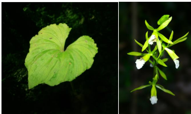
Gambar 2. Nervilia concolor fase vegetatif (kiri) dan fase generatif (kanan)

Hasil inventarisasi pada Desember 2017 menunjukkan bahwa koleksi anggrek KRJP yang telah teridentifikasi sampai tingkat jenis ada 37 jenis. Dengan demikian, KRJP baru mengkonservasi sekitar 6.75% dari 548 jenis anggrek yang ditemukan Sulawesi. KRJP diharapkan dapat meningkatkan koleksi jenis anggrek Sulawesi, baik melalui kegiatan eksplorasi maupun pertukaran koleksi anggrek dengan kebun raya lain. Jenis-jenis anggrek yang telah teridentifikasi sampai tingkat jenis disajikan pada Tabel 1. Ketiga puluh tujuh jenis anggrek tersebut ada yang merupakan anggrek epifit maupun anggrek terestrial. Beberapa jenis anggrek ada yang dikoleksi dari satu lokasi eksplorasi saja, dua lokasi eksplorasi, maupun dari ketiga lokasi eksplorasi. Contoh koleksi anggrek yang berasal dari ketiga lokasi eksplorasi adalah Nervilia concolor (Blume) Schltr. Nervilia concolor merupakan anggrek tanah yang