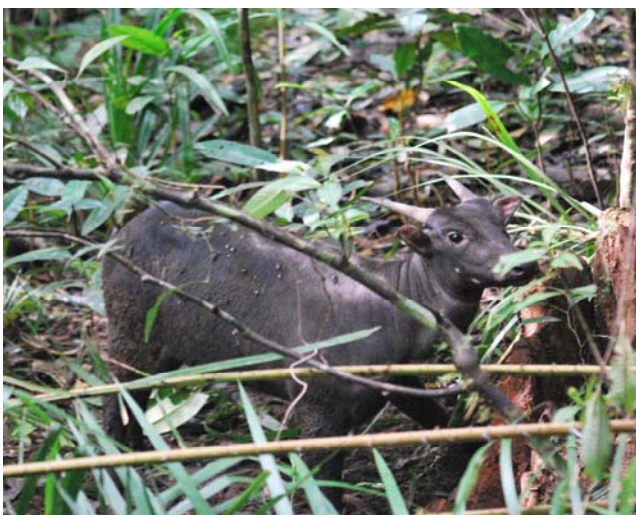
Gambar 2. Anoa dapat dijumpai di puncak Gunung Imandi TNBNW.

sehingga menyebabkan adanya perubahan perilaku bagi anoa yang sangat sensitif terhadap gangguan yaitu dengan mencari tempat yang relatif lebih aman seperti di puncak