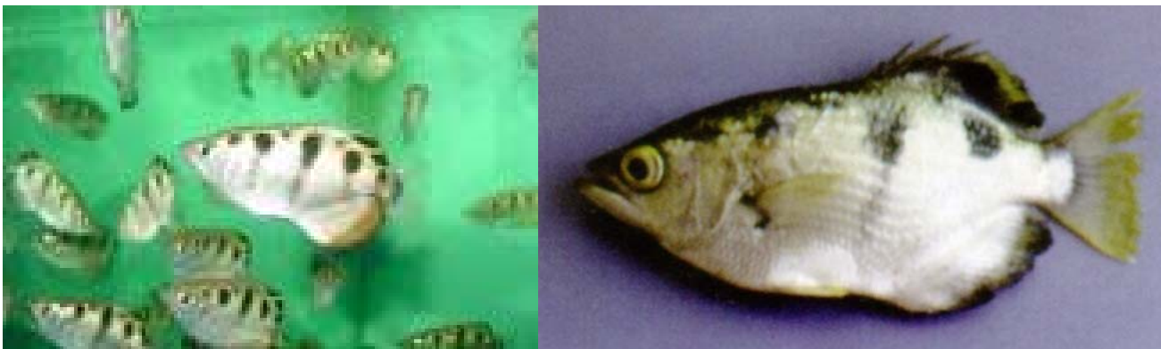
Gambar 1. Jenis ikan sumpit ( Toxotes jaculatrix )

Sintasan ikan sumpit 73,33% yang diberi pakan jenis larva magot lebih tinggi dibandingkan pemberian jenis pakan larva ulat hongkong. Dalam hal ini keduanya jenis pakan tersebut mengandung kitin, tetapi maggot lebih lama dipermukaan dibandingkan larva ulat hongkong. Kesempatan ikan sumpit untuk makan jenis maggot lebih baik dibanding jenis larva ulat hongkong. Selain itu maggot ini dikembangkan pada media (bungkil kelapa sawit), sehingga memiliki nutrisi tinggi (Falicia et al. 2014). Ikan yang diberi nutrisi yang sesuai kebutuhannya akan mempengaruhi sintasan.