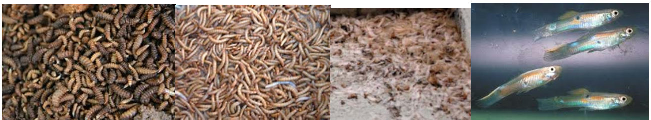
Gambar 2. Jenis pakan dari kiri: Maggot Hermitia illucans , larva ulat hongkong Tenebrio molitor , laron Macrotermis gilvus dan ikan seribu Poecilia reticulata