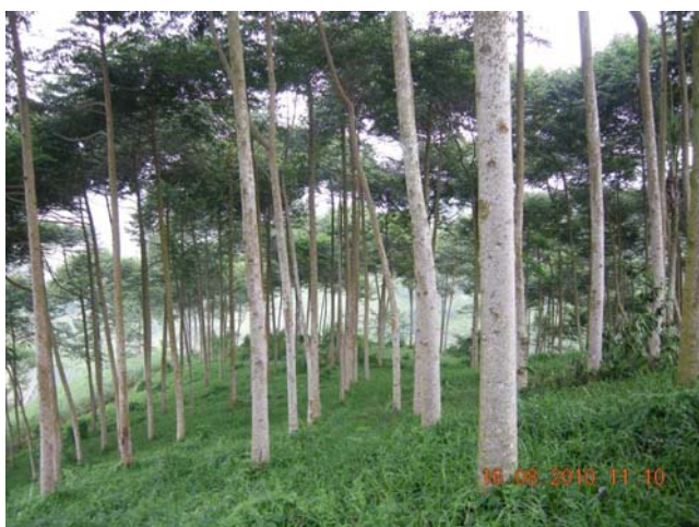
Gambar 6. Peningkatan produktivitas lahan kritis dengan pertanaman tanaman keras yakni kayu afrika yang diinokulasi dengan jamur mikorisa

Keterangan: Kontrol: tanaman yang tidak diinokulasi dengan mikorisa, BioVAM: tanaman yang diinokulasi dengan BioVAM