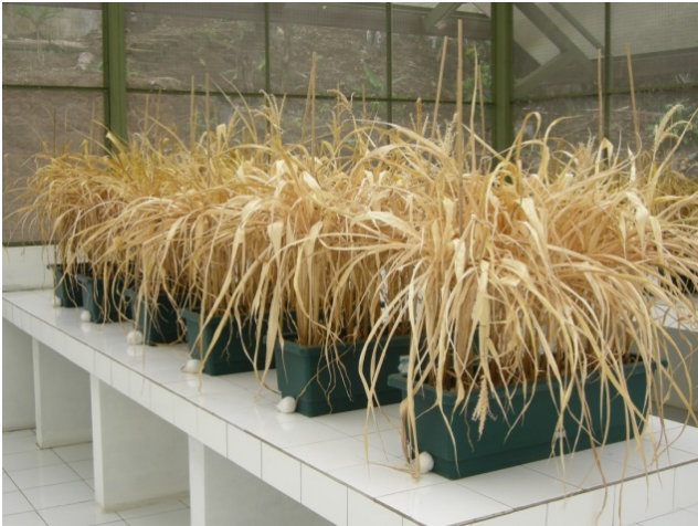
Gambar 2. Produksi pupuk hayati mikorisa pada saat periode "stressing" untuk merangsang pembentukan spora