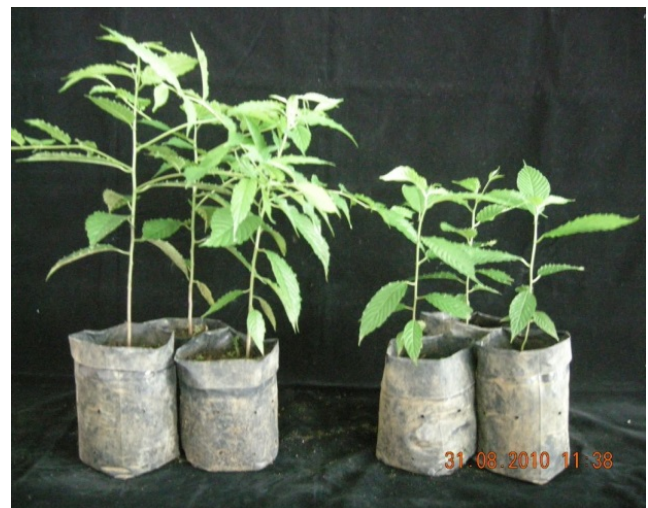
Gambar 5. Pengaruh pemberian inokulum mikorisa pada tanaman kayu afrika ( Meisopsis emenii ) ditingkat semai

Penggunaan pupuk hayati BioVAM telah di uji pada sejumlah jenis tanaman, salah satunya adalah kayu afrika ( Meisopsis emenii ). Hasil pengujian menunjukkan bahwa pemberian inokulan BioVAM mampu meningkatkan pertumbuhan tanaman secara signifikan (Gambar 5.)