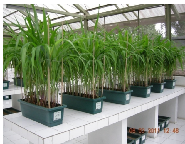
Gambar 1. Produksi pupuk hayati berbasis mikorisa di rumah kaca,dan spora jamur mikorisa yang mengifeksi akar tanaman

Produksi pupuk hayati dilaksanakan dengan teknologi yang dikembangkan dari teknologi Osaka Gas Co.Ltd. Produksi biomasa akar terinfeksi jamur mikorisa dilakukan dengan menggunakan tanaman inang jagung ( Zea mays ) var.BISMA.Media tanah digunakan sebagai media tumbuh tanaman inang dan metoda penanaman biji jagung dilakukan dengan metoda sistem lapis (Gambar 1 dan 2).