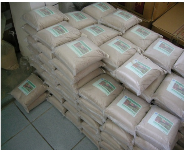
Gambar 4. Produk BioVAM- LIPI

Hasil analisa tanah yang digunakan sebagai dasar untuk produksi pupuk hayati menunjukkan bahwa tipe tanah yang cocok untuk digunakan sebagai bahan pembawa jamur mikorisa adalah tanah dengan pHnetral yaitu antara 5.4 dengan presentasi kemampuan dalam mengontrol mekanisme penyerapan fosphat adalah berkisar 24.1%.