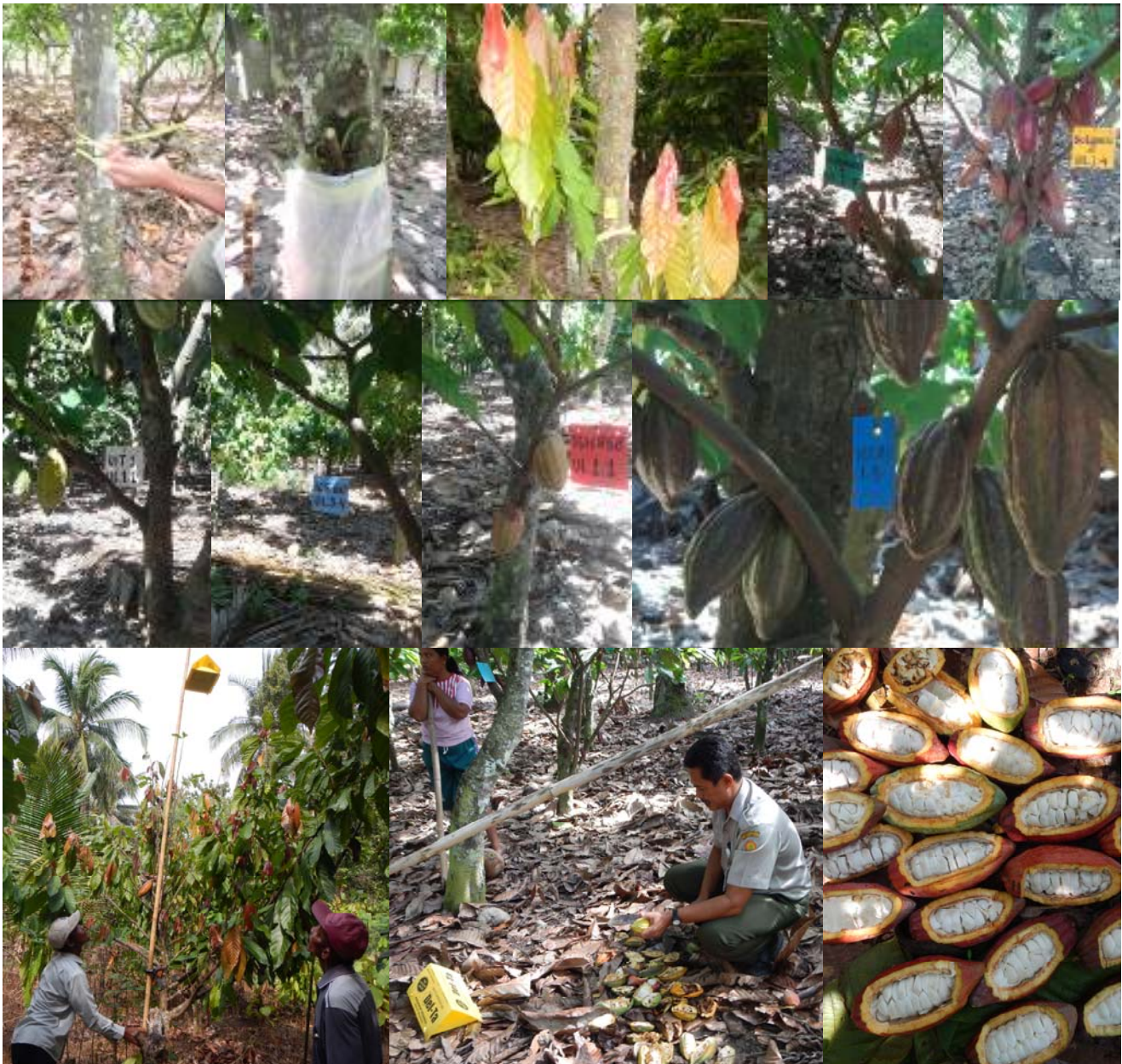
Gambar 2. Keragaan tanaman kakao hasil sambung samping dan penggunaan feromon seks