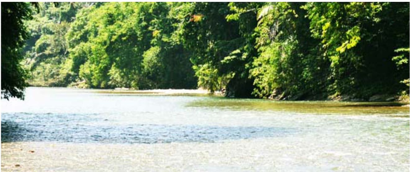
Gambar 3. Keindahan sungai di Taman Nasional Gunung Leuser

TNGL terletak di dua Provinsi, yaitu Provinsi Aceh dan Provinsi Sumatera Utara. Secara yuridis formal, keberadaan TNGL pertama kali dituangkan dalam Pengumuman Menteri Pertanian Nomor: 811/Kpts/Um/II/1980 tanggal 6 Maret 1980 tentang peresmian 5 (lima) Taman Nasional di Indonesia, yaitu Taman Nasional Gunung Leuser, Taman Nasional Ujung Kulon, Taman Nasional Gede Pangrango, Taman Nasional Baluran, dan Taman Nasional Komodo. Berdasarkan pengumuman itu, maka ditetapkanlah luas Taman Nasional Gunung Leuser sementara adalah 792.675 Ha. Pengumuman tersebut ditindaklanjuti dengan Surat Direktorat Jenderal Kehutanan Nomor: 719/Dj/VII/1/80, tanggal 7 Maret 1980 yang ditujukan kepada Sub Balai KPA Gunung Leuser. Dalam surat itu disebutkan bahwa