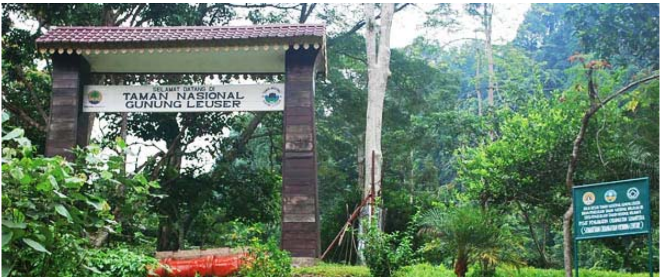
Gambar 2. Fisiognomi Taman Nasional Gunung Leuser