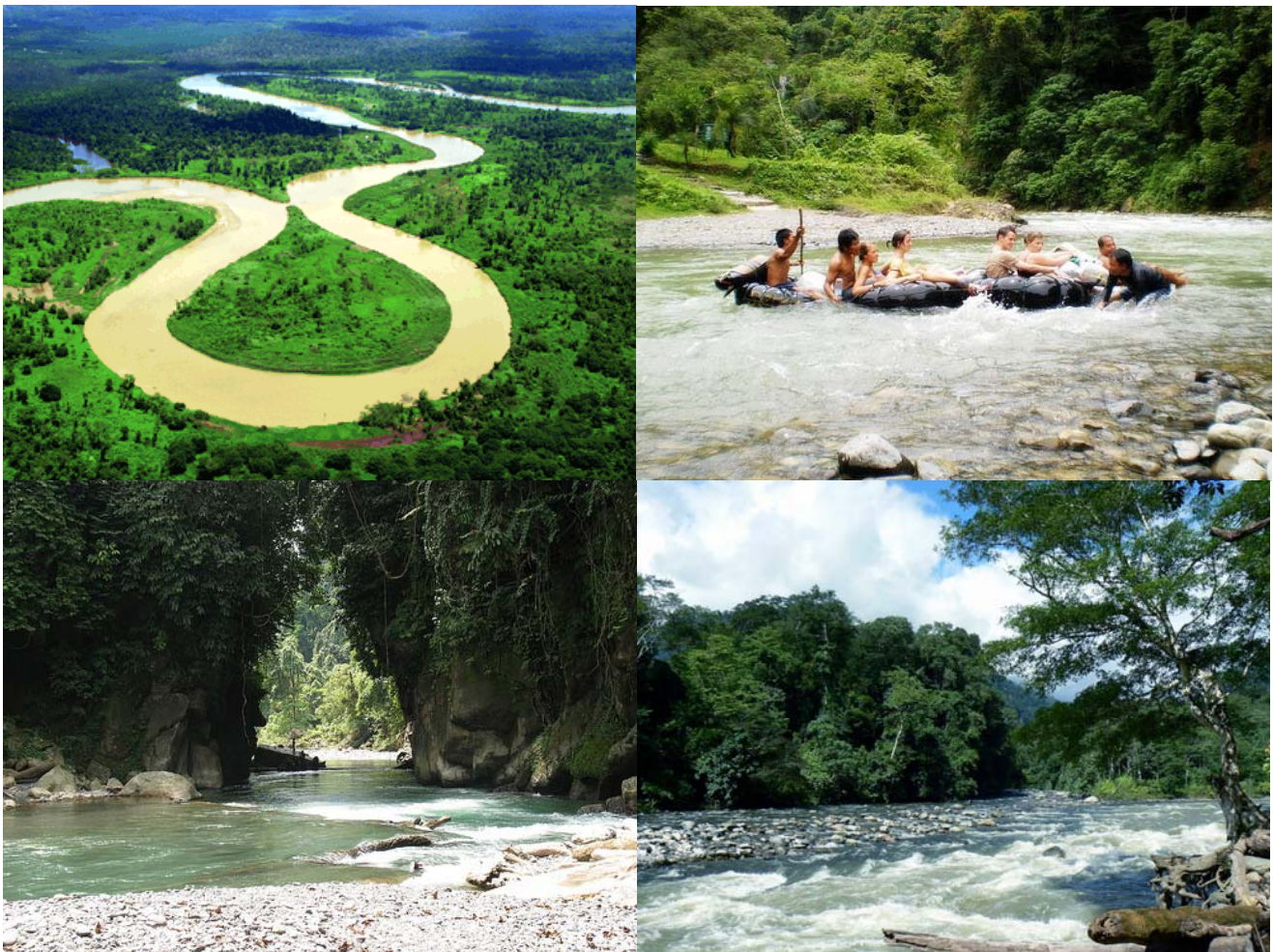
Gambar 4. Kawasan Ekosistem Leuser sebagai Daerah Tangkapan Air

Untuk spesies burung (Aves) di TNGL terdapat paling sedikit 350 spesies yang sudah diidentifikasi. Jumlah ini mewakili 80% spesies burung yang ada di Pulau Sumatera. Sedangkan untuk spesies Reptilia dan Amphibia didominasi oleh spesies-spesies ular (Phyton) dan Buaya, sementara spesies ikan yang khas terdapat di TNGL adalah ikan jurung yang hidup di beberapa sungai yang mengalir di KEL.