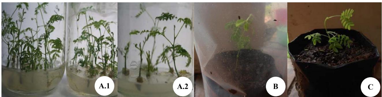
Gambar 3. Pendewasaan dan aklimatisasi planlet sengon hasil multiplikasi, A.1-A.2. Tahap pendewasaan dan perakaran, B. Aklimatisasi, C. Bibit sengon asal kultur in vitro umur 5 bulan