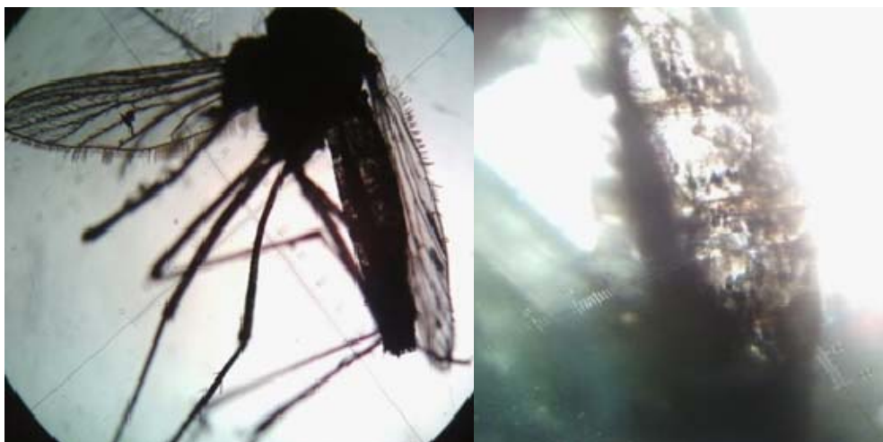
Gambar 2. Nyamuk Ae. aegypti yang telah terinfeksi spora jamur B. bassiana yang telah didedahkan selama 48 jam dengan ditandai perkecambahan spora ( p=10\times 10 )