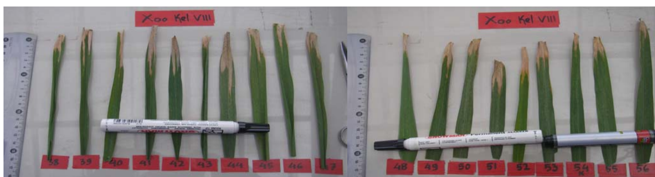
Gambar 2. Gejala dau terinfeksi Xanthomonas oryzae pv. Oryzae kelompok VIII no 38-56