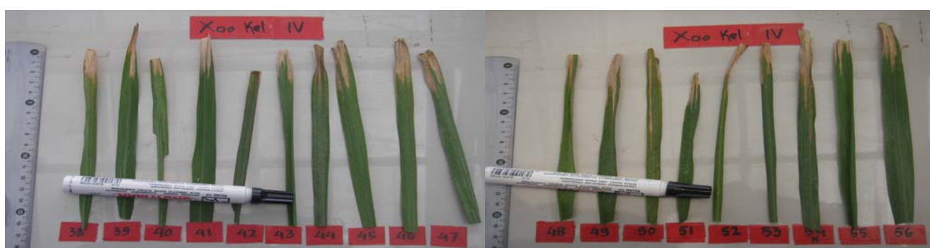
Gambar 3. Gejala dau terinfeksi Xanthomonas oryzae pv. oryzae kelompok IV no 38-56

Pengamatan pada kelompok IV dari 19 varietas unggul yang menunjukkan sifat agak rentan ada 11 varietas (57.9%), agak rentan sebanyak 7 varietas (36.8%) dan rentan ada 1 varietas (5.3%) yaitu varietas Banyuasin (Tabel 3). Hasil pengamatan ke dua terjadi perubahan sifat dari agak rentan menjadi rentan seperti pada Inpara 1,