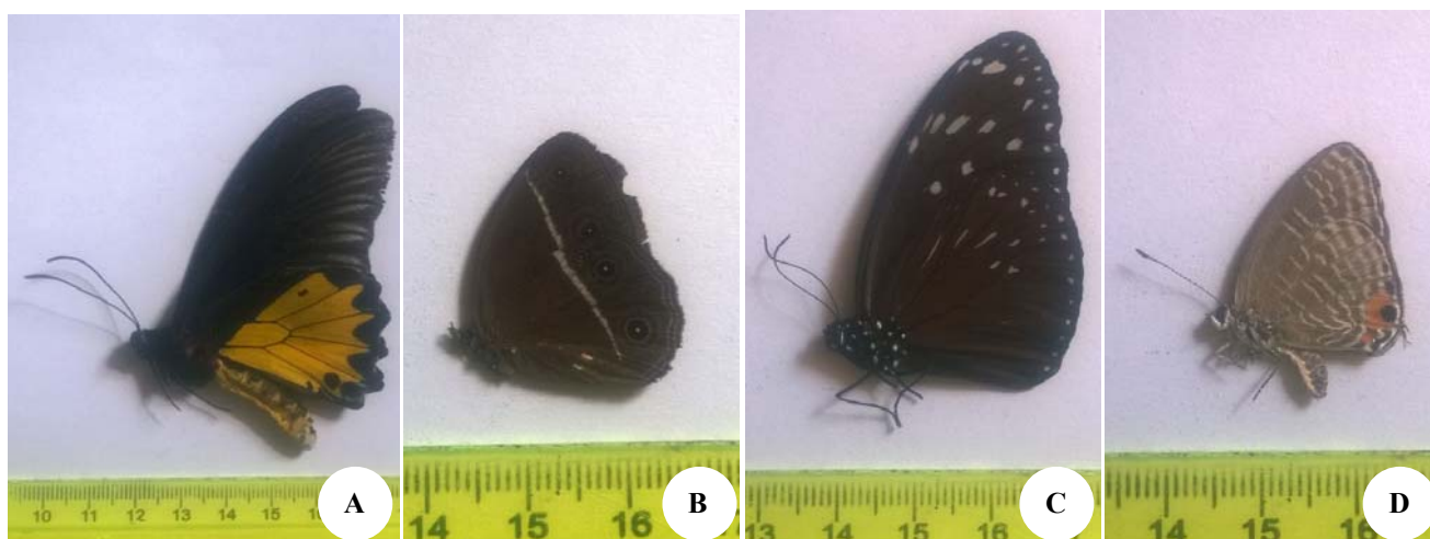
Gambar 2. Empat spesies konstan yang ditemukan pada 4 area kajian penelitian, yaitu (A) Troides helena , (B) Mucalesis mineus , (C) Euploea mulciber , dan (D) Jamides alecto