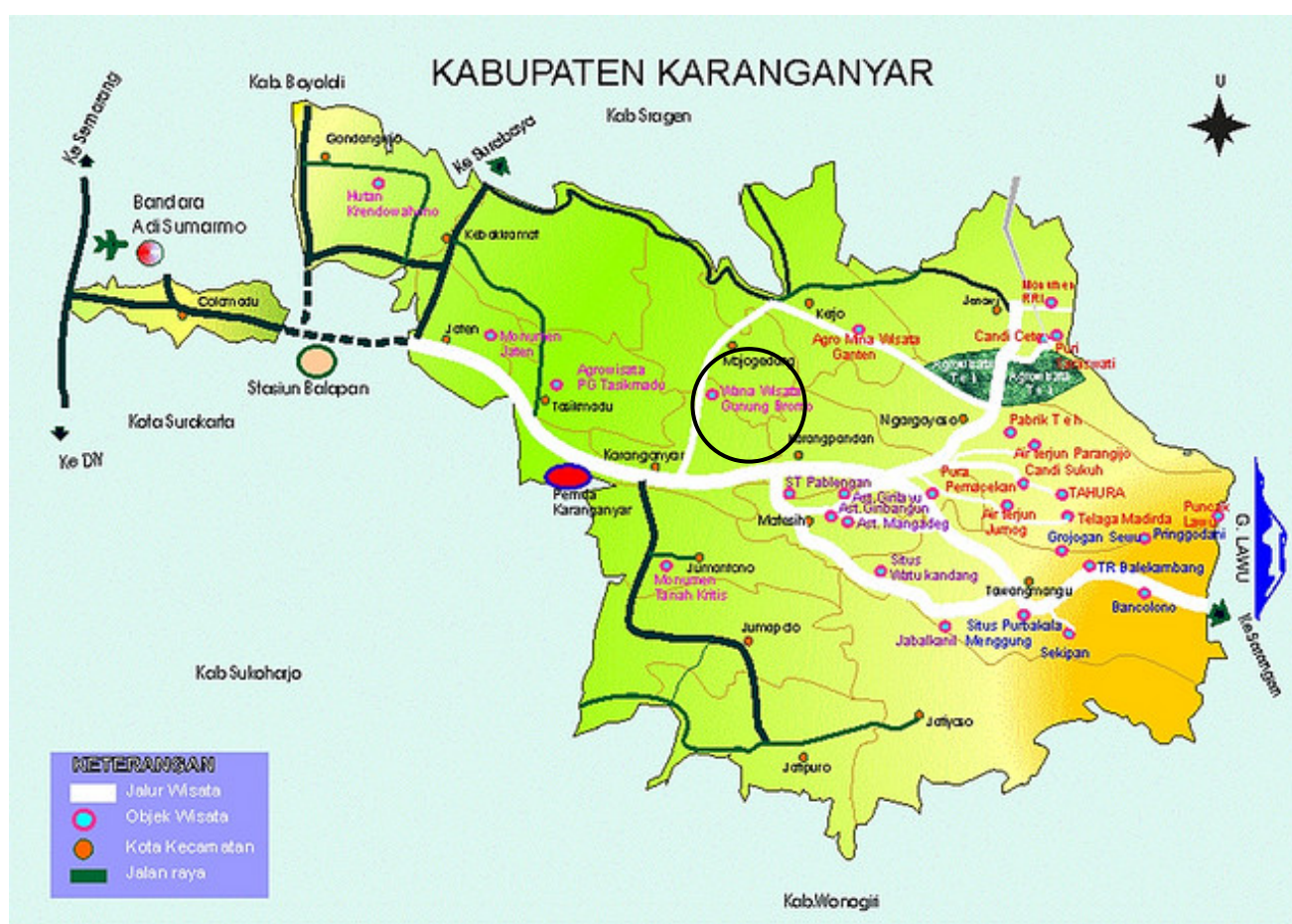
Gambar 1. Peta lokasi Wana Wisata Alas Bromo, BKPH Lawu Utara, Karanganyar, Jawa Tengah

Penelitian ini dilakukan selama dua hari, yaitu pada hari Sabtu, 18 April 2015 dan Minggu, 19 April 2015. Pengambilan sampel dimulai dari pagi hari pukul 08.00-11.00 WIB dan sore hari pukul 15.00-17.00 WIB. Lokasi penelitian adalah di Wana Wisata Alas Bromo BKPH Lawu Utara, Karanganyar, Jawa Tengah (luas \pm 14,390 ha) dengan empat area kajian penelitian, yaitu di kawasan hutan Sonokeling, kawasan hutan Pinus, kawasan hutan Mahoni, dan kawasan hutan Campuran (Gambar 1).