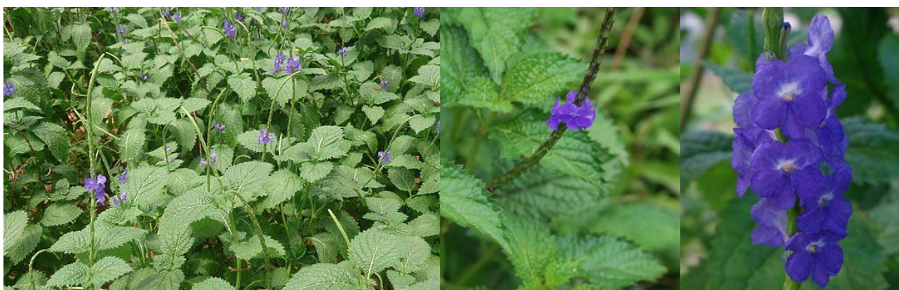
Gambar 3. Stachytarpheta indica (L.) Vahl.