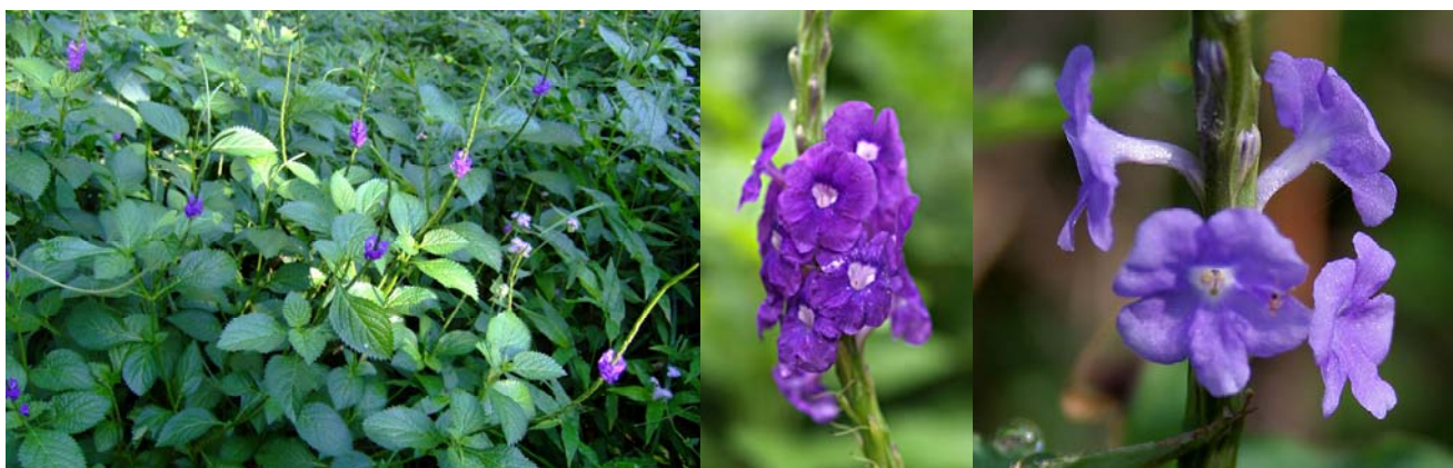
Gambar 1. Stachytarpheta jamaicensis (L.) Vahl. (Foto: berbagai sumber)