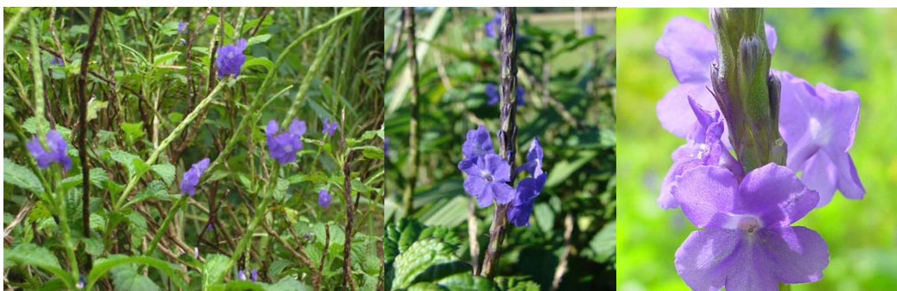
Gambar 2. Stachytarpheta cayenensis (L.C. Rich.) Vahl.