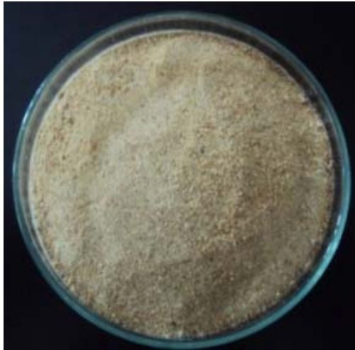
Gambar 1. Simplisia jamur tiram putih ( P. ostreatus )