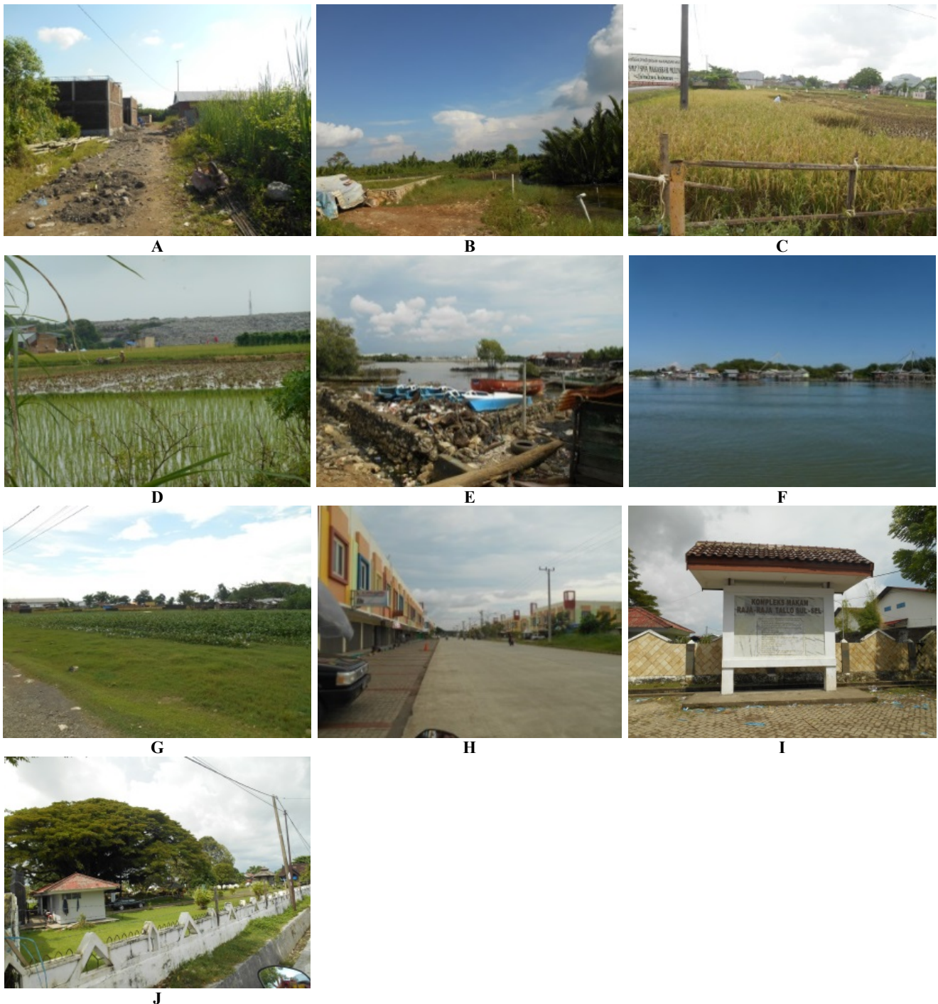
Gambar 3. A-J. Hasil groundtruth berbagai penggunaan lahan

Kecamatan Tamalanrea. (v) Lahan Terbuka. Lahan terbuka adalah lahan terbuka yang di atasnya tidak terdapat bangunan. Biasanya lahan terbuka dulunya adalah lahan sawah yang akan dijadikan area terbangun. Lahan kosong hampir tersebar pada semua kecamatan. Kecamatan Tamalanrea adalah kecamatan yang memiliki luasan lahan terbuka terbesar. (vi) Perairan darat. Persebaran badan air tidak merata di seluruh kecamatan. Kecamatan-kecamatan memiliki badan air yaitu kecamatan Manggala, Panakkukang, Tallo, dan Tamalanrea. (vii) Padang. Padang