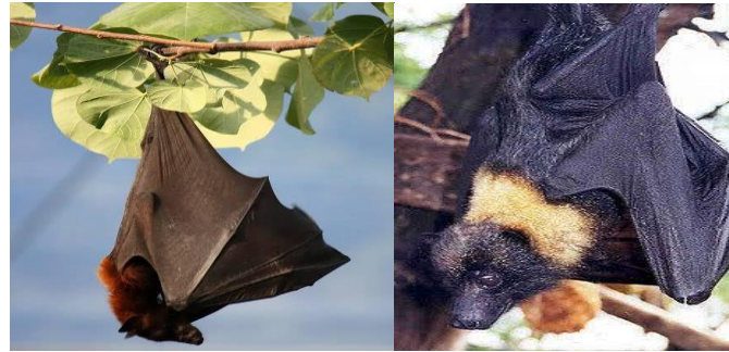
Gambar 2. Kalong hitam ( Pteropus alecto ) di lokasi penelitian