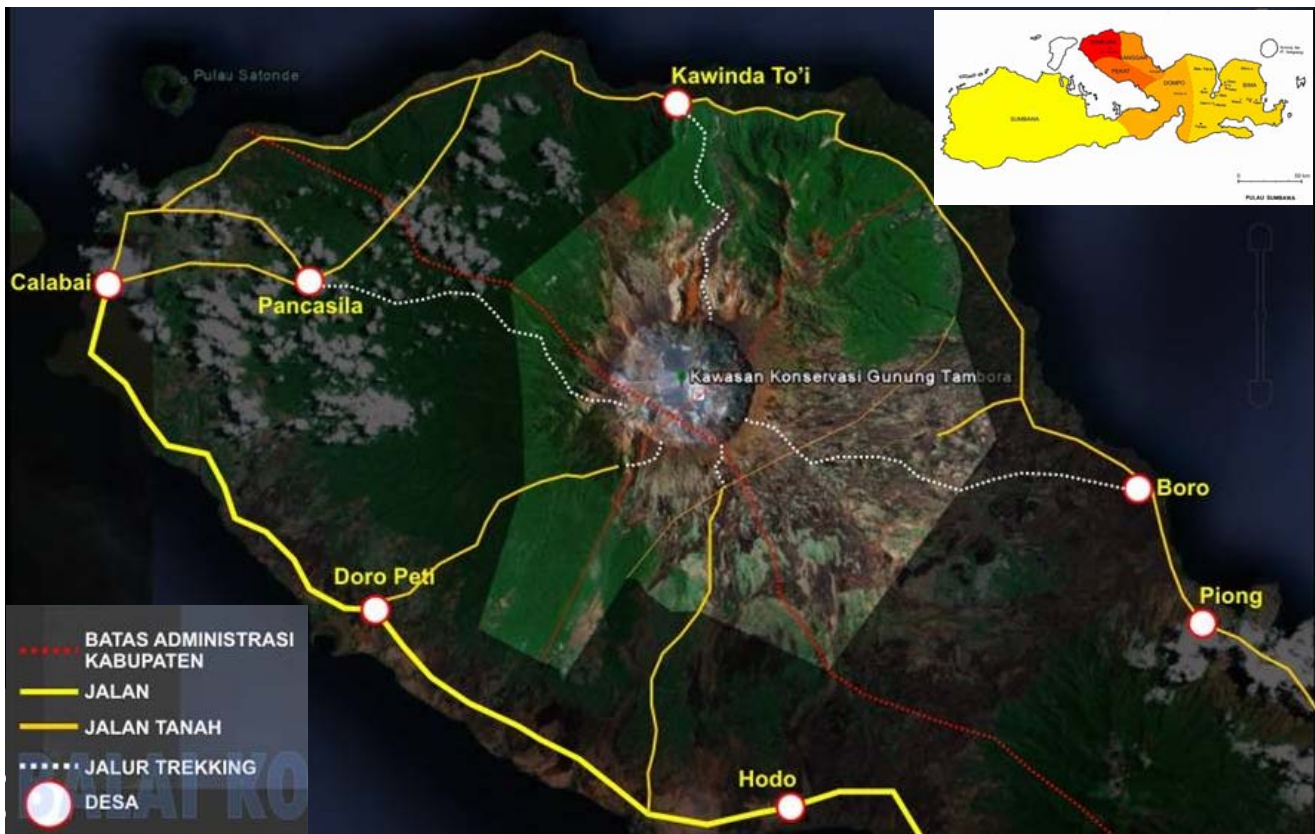
Gambar 1. Lokasi penelitian di Taman Nasional Gunung Tambora, Sumbawa, Nusa Tenggara Barat. Fokus penelitian menyusuri jalur pendakian Kawinda Toi

Penelitian keanekaragaman tumbuhan dilakukan dengan menggunakan metode eksploratif, sedangkan koleksi flora dilakukan dengan metode jelajah, yaitu menjelajahi suatu lokasi yang dapat mewakili tipe-tipe ekosistem ataupun vegetasi di kawasan yang diteliti (Rugayah et al. 2004). Setiap jenis tumbuhan yang dijumpai dikoleksi, terutama yang sedang dalam kondisi berbunga dan/atau berbuah. Bagian tumbuhan yang diambil untuk dikoleksi adalah sebatang ranting yang