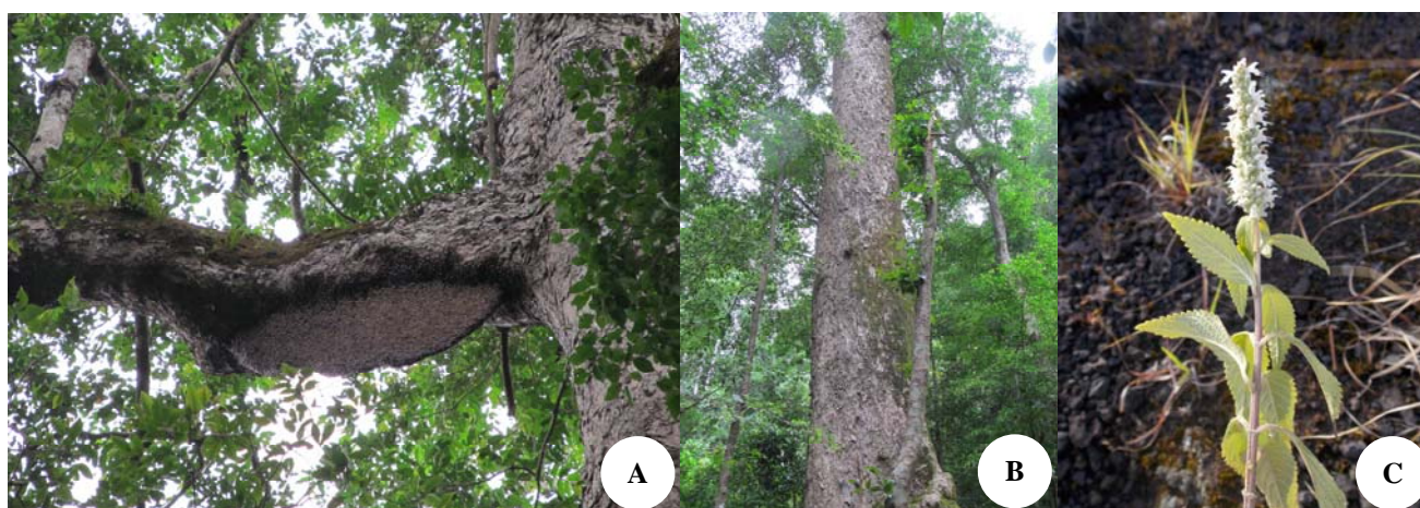
Gambar 3. A. Rumah madu di cabang horizontal Duabanga moluccana , B. Tegakan pohon Duabanga moluccana dengan diameter batang lebih dari 1 m, C. Elsholtzia pubescens

perdu yang juga ditemukan, diantaranya Rubus niveus , Dodonaea viscosa , Hypericum leschenaultii , dan Elsholtzia pubescens . Keberadaan Elsholtzia pubescens (Lamiaceae) menjadi penting karena jenis ini merupakan pakan lebah tanah penghasil madu putih. Jenis madu ini berbeda dengan madu hutan yang banyak ditemukan di dalam hutan. Tumbuhan lain yang banyak dijumpai adalah edelweis. Terdapat 3 jenis bunga abadi di savana Tambora, yaitu Anaphalis javanica , Anaphalis viscida , dan Anaphalis longifolia . Jenis A. javanica merupakan pohon kecil dengan tinggi mencapai 0,5 m dan paling mudah dijumpai.